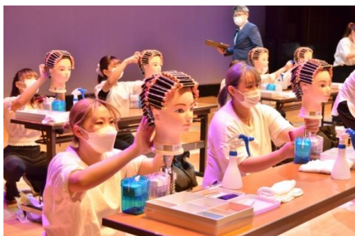
ワインディング競技

大宮校単独では初のビューティコンテストを開催しました。1年生は美容テクニック、2年生はテーマ毎に仕上げた作品を披露し、第一線で活躍する美容師の方々に審査をして頂きました。